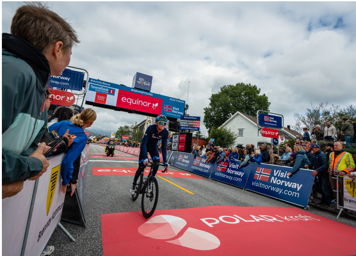
Arctic Race of Norway er verdens nordligste etapperitt på sykkel. Polar Kraft er stolt samarbeidspartner, og hadde ansatte til stede ved alle etapper under rittet i 2022.