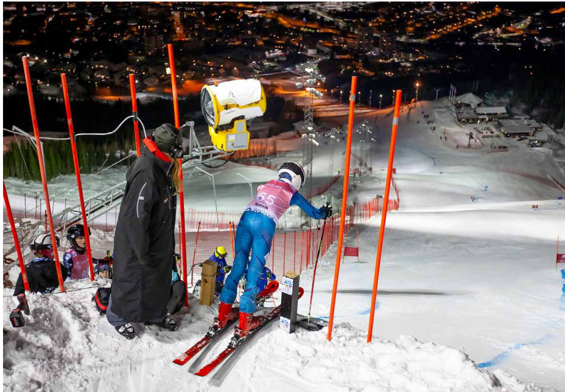
STOR UTBETALING: Konseptet Idrettsstrøm fra Polar Kraft ga hele 45.000 kroner i klubbkassen til Narvik Slalåmklubb i 2023. Pengene skal gå til skiskole og aktiviteter for barn og unge.

bidrar jo også til de største summene som genereres. Idrettsstrøm gir oss rett og slett mulighet til å snakke om strøm på en litt annerledes måte.