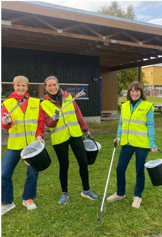
FOKUS: For Yve er det viktig at alle medarbeidere har fokus på bærekraft. Her er ansatte på Tynset-kontoret i sving med å fjerne søppel og plast i naturen.

viktig for oss at potensielle samarbeidspartnere og investorer får et godt innblikk i de gode valgene som Yve og datterselskapene våre gjør. Arbeidsgruppen hjelper oss med å formidle bærekraft i forretningen vår, både innenfor og utenfor organisasjonen.