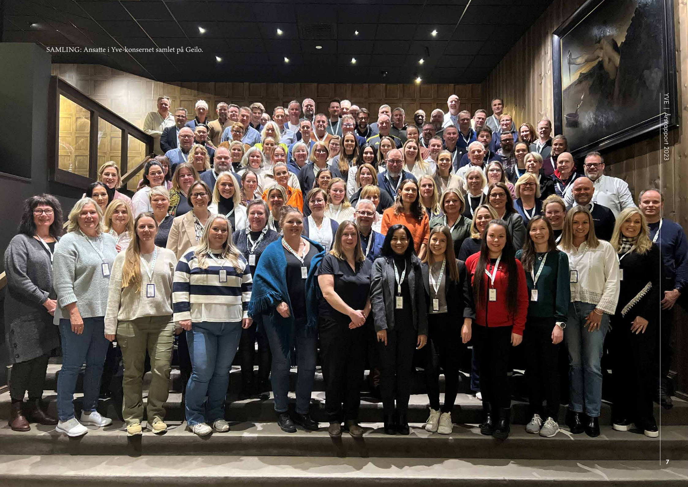
SAMLING: Ansatte i Yve-konsernet samlet på Geilo.